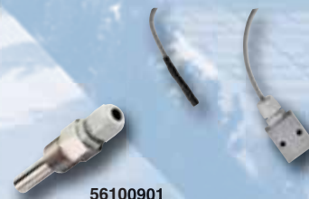
Teplotní čidla jsou součástí Temperature probes are included