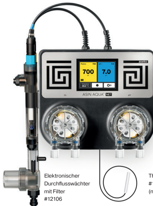
ASIN AQUA oder ASIN AQUA Net